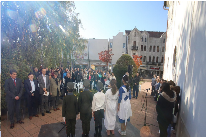
Извођење химне „Боже правде“

На Лазиној клупи, академик је стрпљиво потписивао своје књиге свим присутним гостима, радујући се највише новим младим нараштајима, који ће наставити и обележавати ову традицију.