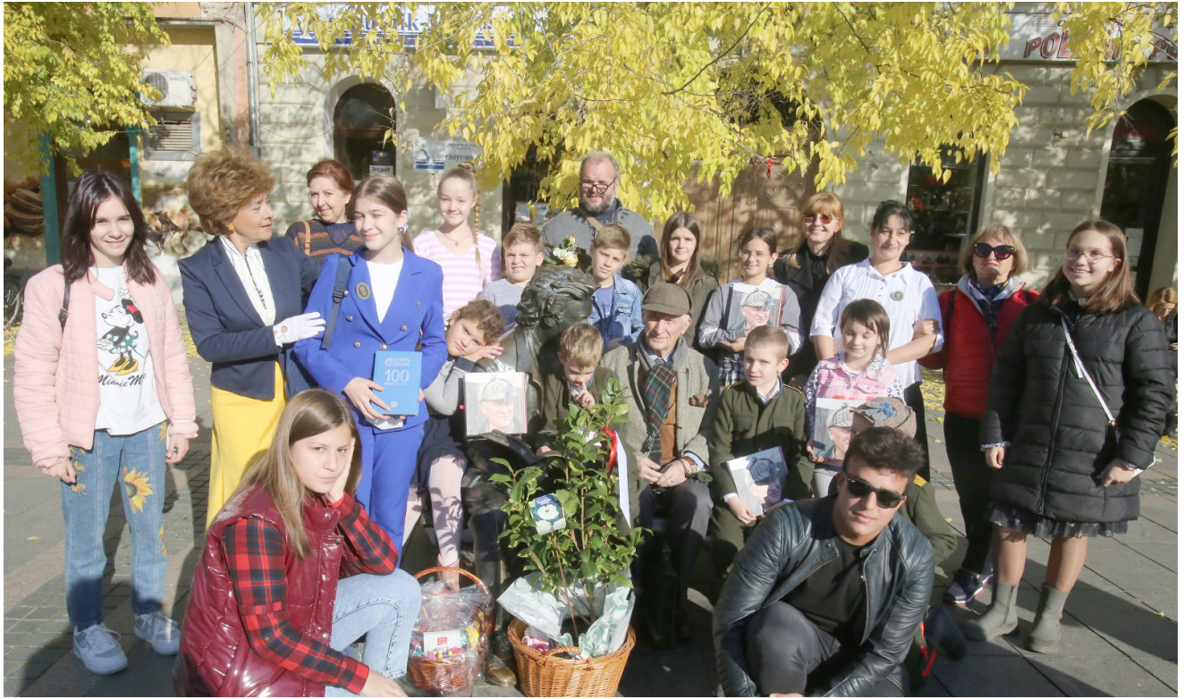
Гимнзијалци са садницом камелије испред Матије Бећковића и његових поштовалаца