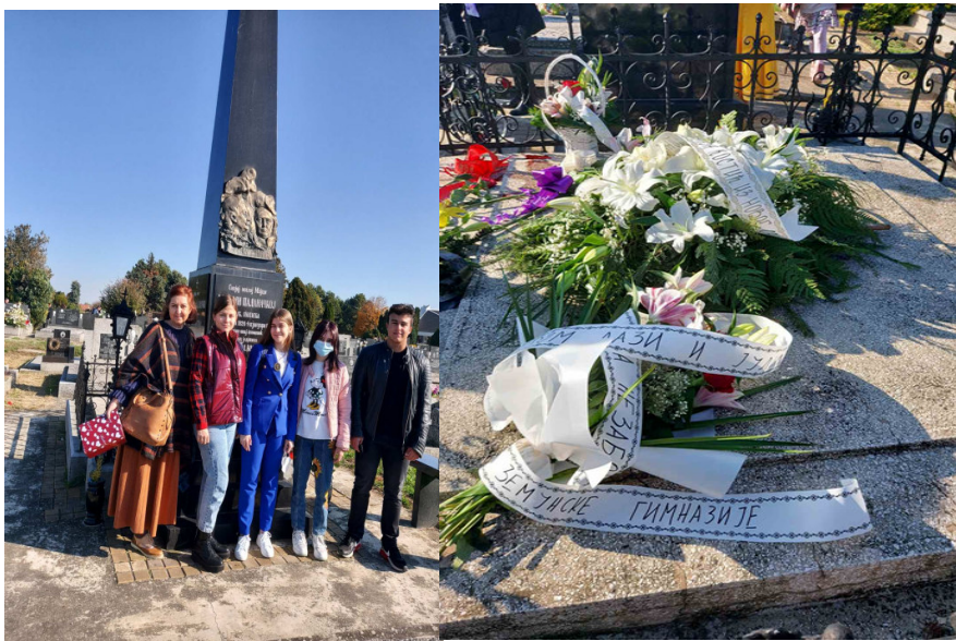
Поред споменика Јулијани и Лазе Костић, професорка и ђаци Земунске гимназије