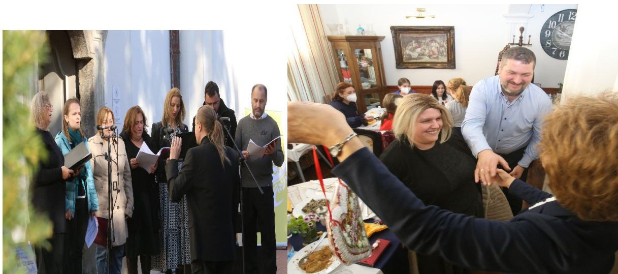
Хор “Св.цар Константин и царица Јелена“ Уживање у сомборским специјалитетима

Крај програмског дела манифестације обележио је сомборски хор „Св.цар Константин и царица Јелена“.